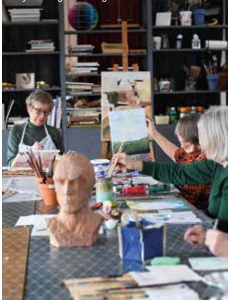
Akrylmålning i Medborgarskolans lokaler

Mer information om våra Fasta Aktiviteter hittar du på vår hemsida uppsala.aktivitaseniorer.com