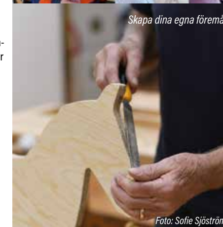
Skapa dina egna föremål