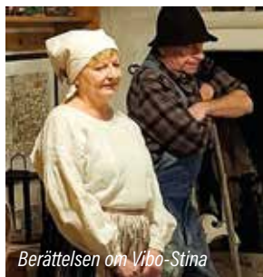
Berättelsen om Vibo-Stina