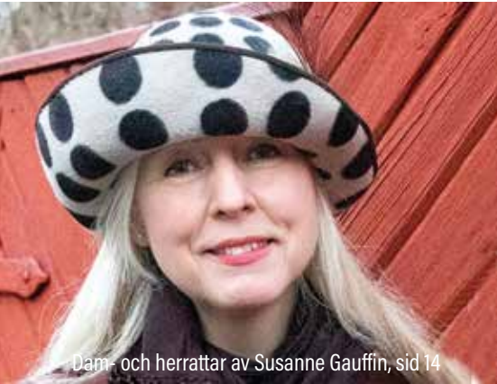
Dam- och herrattar av Susanne Gauffin, sid 14