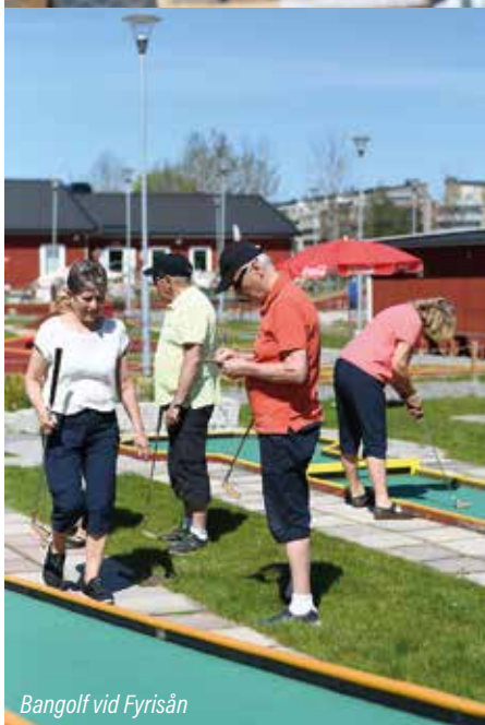
Bangolf vid Fyrishov