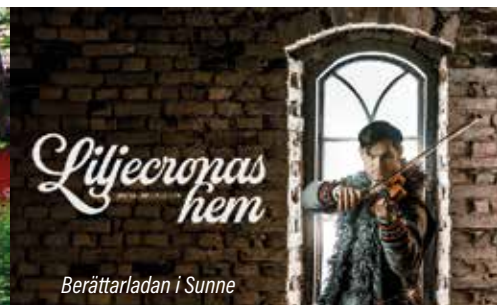
Berättarladan i Sunne