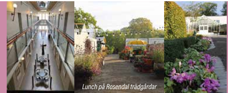
Lunch på Rosendal trädgårdar

Viktigt! Besök vår hemsida lite då och då! Nya aktiviteter kan komma att publiceras under våren.