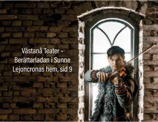
Västanå Teater - Berättarladan i Sunne Lejoncronas hem, sid 9