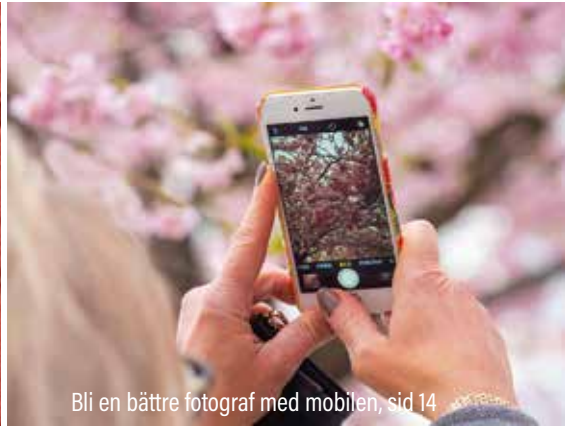
Bli en bättre fotograf med mobilen, sid 14