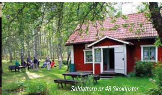
Soldattorp nr 48 Skokloster