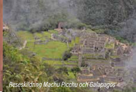
Reseskildring Machu Picchu och Galapagos