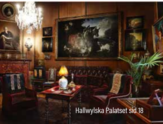
Hallwylska Palatset sid 18