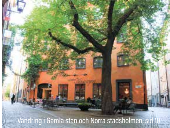
Vandring i Gamla stan och Norra stadsholmen, sid 10