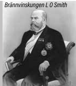
Brännvinskungen L O Smith