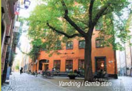
Vandring i Gamla stan