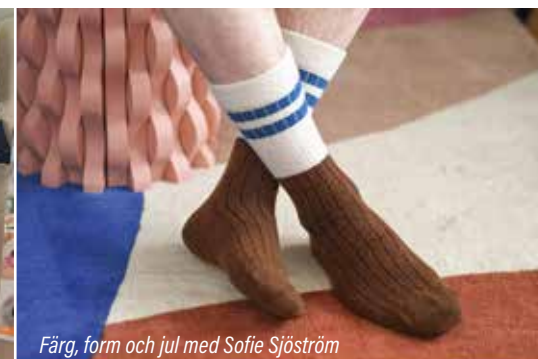
Färg, form och jul med Sofie Sjöström