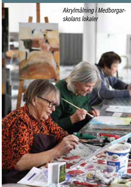
Akrylmålning i Medborgarskolans lokaler

Mer information om våra Fasta Aktiviteter hittar du på vår hemsida uppsala.aktivseniorer.com