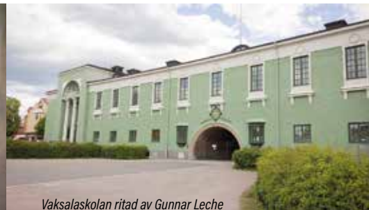
Vaksalaskolan ritad av Gunnar Leche