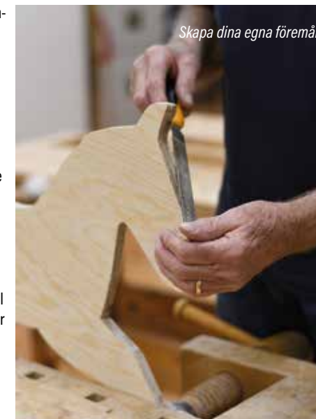
Skapa dina egna föremål