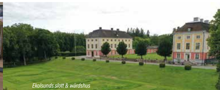
Ekolsunds slott & wärdshus