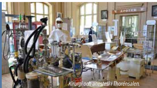
Kirurgi och anestesi i Thorénsalen.